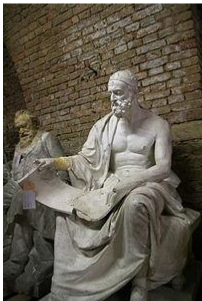
Πολύβιος ο Μεγαλοπολίτης

ρίας μας οι οποίοι σε κάθε ευκαιρία πρόβαλλαν τα χαλκευμένα συνθήματά τους όπως: «Το «ΟΧΙ» δεν το είπε ο Μεταξάς αλλά ο Ελληνικός Λαός» ή «ο Μεταξάς είπε το «ΟΧΙ» αλλά υπό την... πίεση του Λαού» και άλλα παρόμοια.