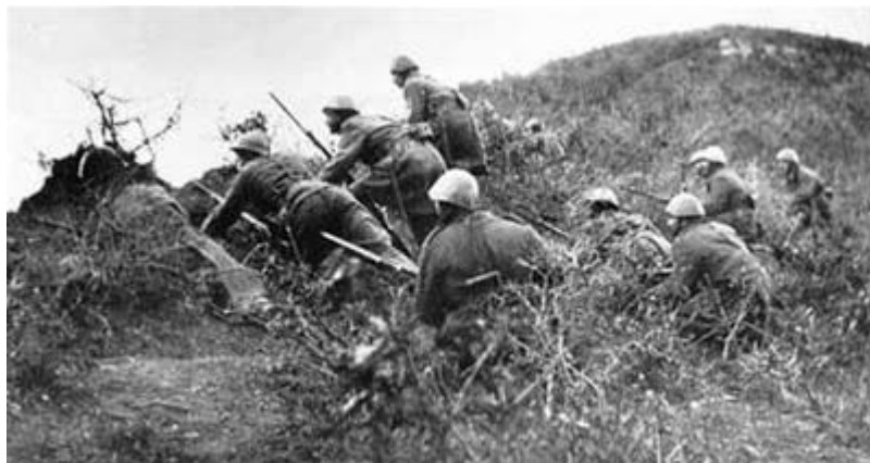
Το θυσιαστικό «ΝΑΙ» στο «ΟΧΙ» ΤΟΥ 1940

ετάχθη». Τα πάντα κινητοποιήθηκαν υπέρ των μαχομένων στρατευμάτων. Και ο πόλεμος ξεκίνησε. Ο εχθρός, καίτοι υπέρτερος σε πολεμικά μέσα και έμψυχο υλικό, υποχώρησε κατά κράτος, η Νίκη ήλθε νομοτελειακά, η αλύτρωτη Βορ. Ηπειρος απελευθερώθηκε για μια ακόμη φορά και το Έπος του '40 έλαβε την περίληψη θέση του στην παγκόσμια Ιστορία.