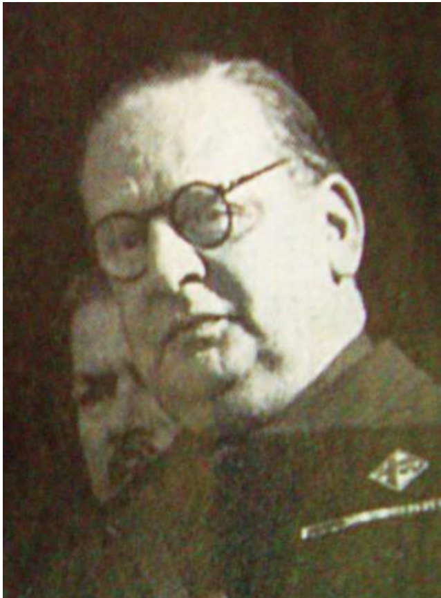
Ο Εμμανουέλλε Γκράτσι

Η ώρα ήταν περίπου 3 η πρωινή της 28 ης Οκτωβρίου 1940, όταν το αυτοκίνητο του ιταλικού Διπλωματικού Σώματος σταμάτησε έμπροσθεν της οικίας του Πρωθυπουργού Ιωάννη Μεταξά, στην Κηφισιά. Επέβαιναν ο Πρεσβευτής της Ιταλίας Εμμανουέλλε Γκράτσι, ο Στρατιωτικός Ακόλουθος Συνταγματάρχης Μοντίνι και ο Αλβανός διερμηνέας Ντε Σάντο που ζήτησε από τον φρουρό να ειδοποιήσει τον Πρωθυπουργό για την αναπάντεχη αυτή νυκτερινή επίσκεψη. Ο Μεταξάς, αφυπνισθείς, κοίταξε από την πλαϊνή πόρτα της οικίας και, διακρίνοντας στο μισοσκόταδο τον Γκράτσι, κατάλαβε τον σκοπό της επίσκεψής του. Το ρολόι της Ιστορίας είχε πλέον αρχίσει να πορεύεται αντίστροφα προς την νεότερη Δόξα της Ελλάδος.