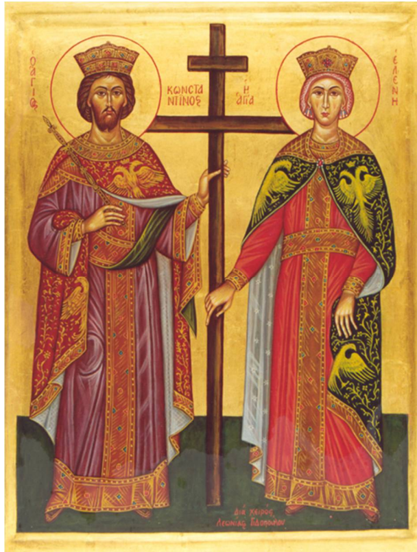
Σύνταξη – Επιμέλεια Ευάγγελος Μαυρογόνατος