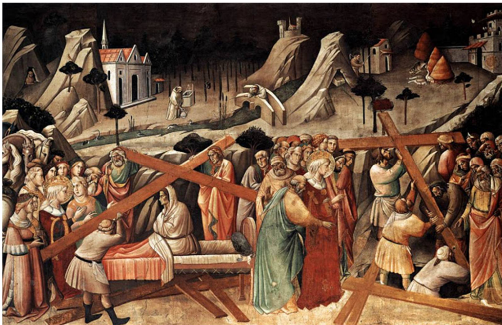
Η εύρεση του Τιμίου Σταυρού από την Αγία Ελένη, τοιχογραφία, 1385, Agnolo GADDI, Φλωρεντία. Ο πίνακας δείχνει την εύρεση των τριών σταυρών, του Χριστού και των δύο ληστών (δεξιά) και τη δοκιμή για το ποιός από αυτούς ήταν ο αληθινός Σταυρός του Χριστού (αριστερά).

να παραμεληθούν, πρόσταξε να αποσυναρμολογηθούν, και με την εναλλαγή των οριζοντίων ξύλων τους να σχηματισθούν δύο νέοι Σταυροί.