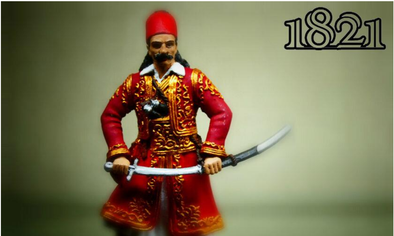
«Ο Αχιλλέας της Ρωμιοσύνης»