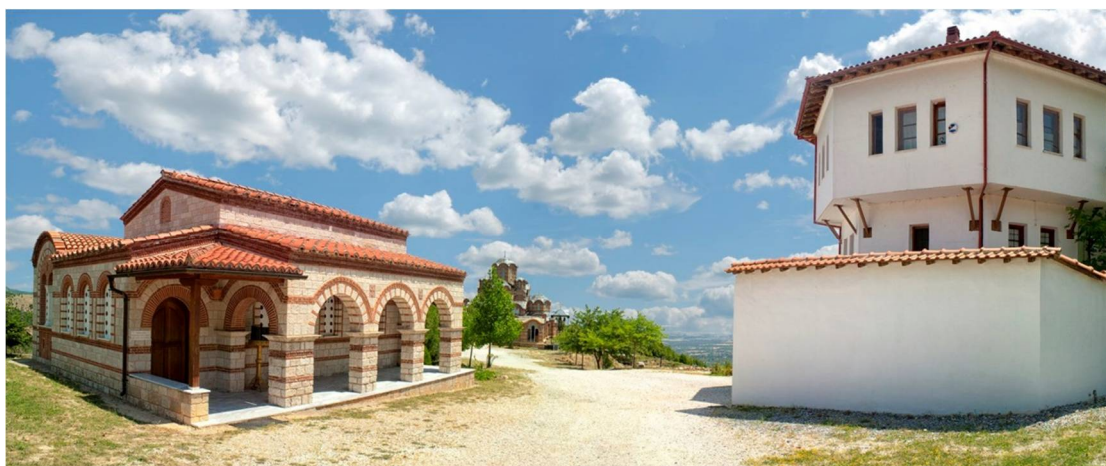
Εικόνα 3 Στην είσοδο της Μονής

Πρόκειται για νέο ανδρικό μοναστήρι. Ιδρύθηκε το 1992 από τον μητροπολίτη Γουμενίσσης Δημήτριο και τη συνοδεία του και είναι καρπός της ιδιαίτερης ευλάβειας τους προς τους νεοφανείς μάρτυρες Αγίους Ραφαήλ, Νικόλαο και Ειρήνη, οι οποίοι εμφανίστηκαν στην εποχή μας (1959-1962), στο νησί της Λέσβου, 500 χρόνια μετά το μαρτύριο τους.