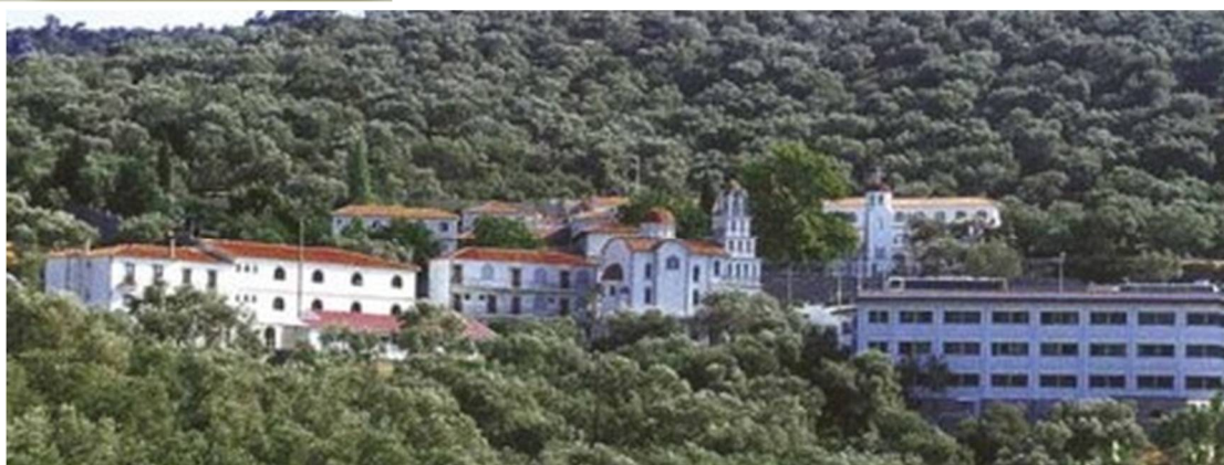
Εικόνα 4 Ιερά Μονή Μυτιλήνης

Οι τρεις άγιοι, ο Άγιος Ραφαήλ, ο Άγιος Νικόλαος και η Αγία Ειρήνη εμφανίστηκαν πολλές φορές και σε πολλούς κατοίκους της Θερμής και των γύρω χωριών, και αποκάλυψαν ότι το έτος 1463 επιτέθηκαν οι Τούρκοι σε ένα μοναστήρι που βρίσκονταν στον λόφο πάνω από την Θερμή, βασάνισαν φρικτά και σκότωσαν τους τρεις αγίους καθώς και πολλούς μοναχούς και κατοίκους που είχαν καταφύγει στο μοναστήρι.