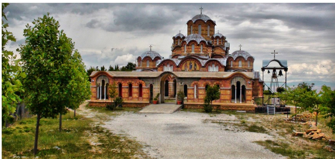
Εικόνα 2 Καθολικός Ιερός Ναός της Μονής

Ο εν λόγω χώρος υποδείχτηκε, σύμφωνα με καταγεγραμμένες μαρτυρίες, με θαυμαστό τρόπο στον Σεβασμιότατο Μητροπολίτη Γουμενίσσης κ.κ. Δημήτριο, από τον Άγιο, και ο κάθε προσκυνητής που έχει μεταβεί στον τόπο του μαρτυρίου των Αγίων στη Θερμή της Λέσβου, και μεταβαίνει και σε αυτόν της Ιεράς Μονής Γρίβας Κιλκίς, νοιώθει ότι ευρίσκεται στον πραγματικό τόπο του μαρτυρίου τους.