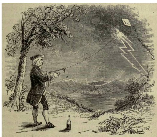
Εικόνα 6 Βενιαμίν Φραγκλίνος

Στη δεύτερη περίπτωση, ένας κληρικός αναφέρει στο ημερολόγιό του ότι χρησιμοποιούσαν τον χαρταετό σαν παιχνίδι χαράς την ημέρα του Πάσχα.