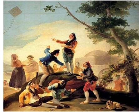
Εικόνα 5 Μάρκο Πόλο

Πολύ αργότερα ο Μάρκο Πόλο γυρίζοντας από τα ταξίδια του, φέρνει το χαρταετό στην Ευρώπη του Μεσαίωνα, όπου τον περιγράφει και για τις επικίνδυνες επανδρωμένες πτήσεις του.