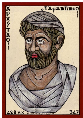
Εικόνα 4 Αρχύτας

Αλλά και στην ελληνική αρχαιότητα, ο χαρταετός δεν ήταν άγνωστος. Αναφέρεται ότι ο αρχιμηχανικός Αρχύτας του Τάραντα -4ος αι. π. Χ.- χρησιμοποίησε στην αεροδυναμική του τον αετό, ενώ υπάρχει και ελληνικό αγγείο της κλασικής εποχής με παράσταση κόρης, η οποία κρατά στα χέρια της μια μικρή λευκή σαΐτα (είδος αετού) με το νήμα της, έτοιμη να την πετάξει.