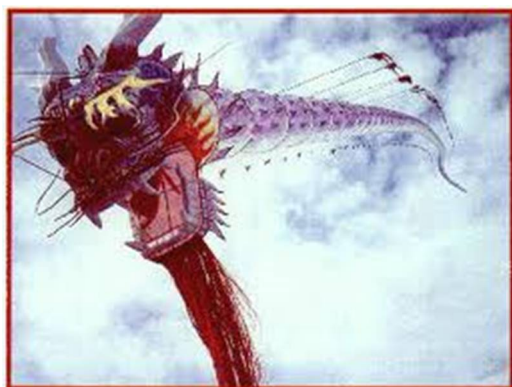
Εικόνα 2 Κίνα χαρταετός Γουέν

Ο αυτοκράτορας της Κίνας Γουέν Χσουν έκανε πειράματα πτήσεων με αετούς φτιαγμένους από μπαμπού, χρησιμοποιώντας για επιβάτες τους κρατούμενούς του.