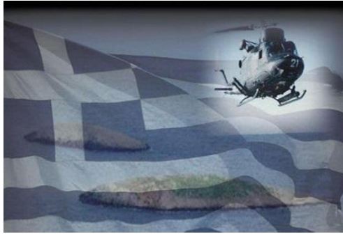
Εικόνα 1 Ελικόπτερο ΑΒ - 212

Περίπου στις 05:00 τα ξημερώματα απογειώνεται από την φρεγάτα ΝΑΥΑΡΙΝΟ του Ελληνικού ναυτικού ένα ελικόπτερο ΑΒ-212 για να επιθεωρήσει πάνω από την μικρή βραχονησίδα και να δει εάν οι Τούρκοι κομάντος είναι ακόμη εκεί ή έχουν εγκαταλείψει τις θέσεις τους.