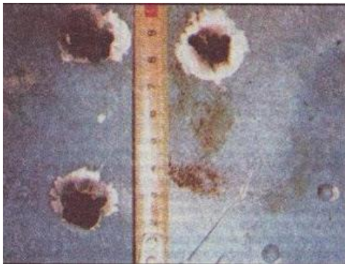
Εικόνα 2 Άτρακτος ελικοπτέρου

Η επισυναπτόμενη φωτογραφία δείχνει την άτρακτο του ελικοπτέρου που φαίνονται καθαρά οι τρύπες από τις σφαίρες των Τούρκων (μοιάζουν για τρύπες από πριτσίνια;).