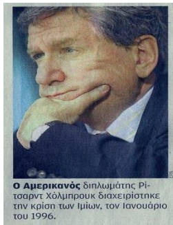
Ο Αμερικανός διπλωμάτης Ρίτσαρντ Χόλμπρουκ διαχειρίστηκε την κρίση των Ιμίων, τον Ιανουάριο του 1996.

τους και φυσικά με την διαμεσολάβηση των Αμερικανών (τυχαίο;) αποφεύγεται η γενικευμένη πολεμική σύρραξη.