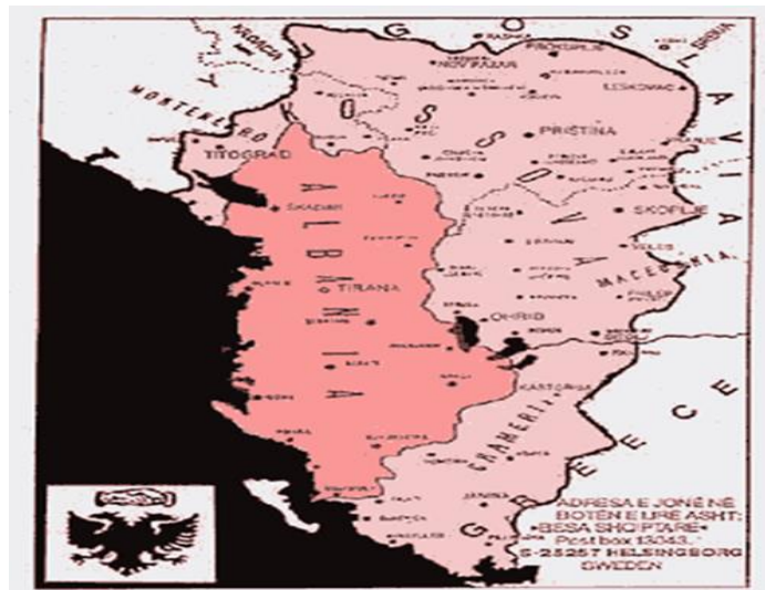
Ο Αλυτρωτικός χάρτης των Αλβανών εθνικιστών

Πρόσφατα, Φεβρουάριος 2016, οργανώσεις Τσάμηδων προσέφυγαν στο Διεθνές Ποινικό Δικαστήριο της Χάγης, που εξετάζει κυρίως εγκλήματα πολέμου, όπου κατατέθηκε ο φάκελος για τις διεκδικήσεις των Τσάμηδων στην Ελλάδα, ο οποίος έγινε δεκτός από τον Εισαγγελέα. Έτσι ένα θέμα, που έμενε ουσιαστικά κλειστό επί εβδομήντα και πλέον χρόνια, φαίνεται ότι ανοίγει με επίσημο τρόπο. Οι Τσάμηδες ζητούν πέρα από τις οικονομικές αποζημιώσεις, εδάφη της Ηπείρου, όπως της Ηγουμενίτσας, της Πάργας κι άλλων περιοχών. Στην παράδοση του φακέλου παραβρέθηκαν εκπρόσωποι πολλών εθνικιστικών συλλόγων από την Αλβανία αλλά και από περιοχές όπου ζουν αλβανόφωνοι πληθυσμοί.