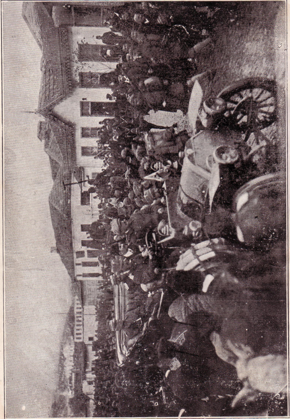
ΚΑΤΑΛΗΨΙΣ ΤΗΣ ΘΕΣΣΑΛΟΝΙΚΗΣ ΥΠΟ ΤΗΣ 7 ΗΣ ΜΕΡΑΡΧΙΑΣ 26 - 27 ΟΚΤΩΒΡΙΟΥ 1912