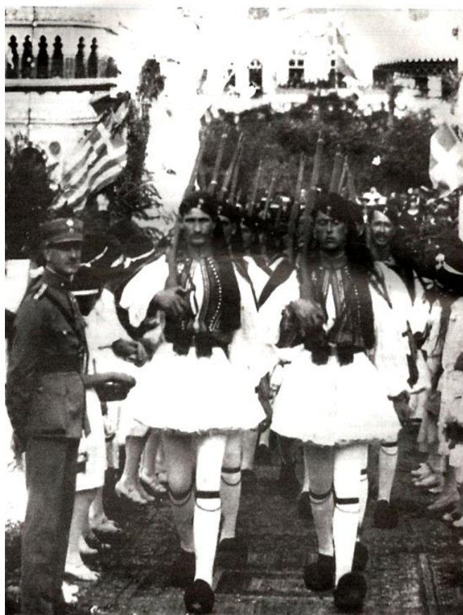
Μαΐου 1919 οι πρώτοι άνδρες του 1/38 Συντάγματος Ευζώνων αποβιβάζονται στη σημαριοστολισμένη Σμύρνη.

Του Ευαγγέλου Γριβάκου, Αντιστρατήγου ε.α – Νομικού