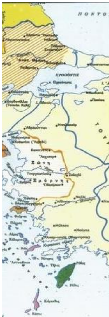
Η Ζώνη της Σμύρνης (Σαντζακία Σμύρνης και Αϊδινίου)

Αρόδου του λιμένα της Σμύρνης, προς παρακολούθηση της απόβασης, ήταν αγκυροβολημένοι οι στόλοι των Συμμάχων ( ο αγγλικός , υπό τον ναύαρχο Κάλθροπ που είχε και το γενικό πρόσταγμα, ο γαλλικός, ο αμερικανικός με το θωρηκτό «Αριζόνα», ο ιταλικός με το θωρηκτό «Ντουΐλιο» και ο ελληνικός με το θωρηκτό « Αβέρωφ » και κυβερνήτη τον πλοίαρχο Ηλία Μαυρουδή ). Οι διοικητές των στόλων με μεγάλη ανησυχία παρακολουθούσαν όλη την ημέρα τα διαδραματιζόμενα και ενημέρωναν τις κυβερνήσεις τους. Δικαίως ή αδικως, η Χώρα δυσφημίσθηκε στους Συμμάχους. Οι Γάλλοι προσπάθησαν να διαστρεβλώσουν τα γεγονότα διαδίδοντας ότι η Ελλάδα ήταν η αποκλειστική υπεύθυνη και ανήμπορη να επιβάλλει την τάξη και ο Ιταλός κυβερνήτης του «Ντουΐλιο», ισχυριζόμενος ότι η ελληνική απόβαση απέτυχε, έστειλε σήμα προς την ναυαρχίδα του Κάλθροπ και πρότεινε όπως «τα συμμαχικά στρατεύματα αποβιβαθούν στη Σμύρνη προς επιβολή της τάξεως και προστασία των υπηκόων τους» . Ο Κάλθροπ, ευτυχώς, απέρριψε την πρόταση και απάντησε στον Ιταλό ναύαρχο ότι «τελικά οι Έλληνες θα δυνηθούν να επιβάλλουν την τάξη» , όπως και πράγματι έγινε.