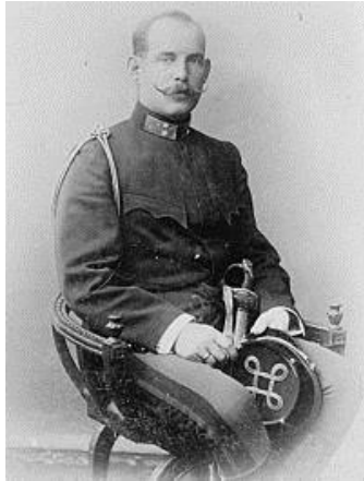
Εικόνα 7 Διάδοχος Κων/νος

Ο Σμολένσκις διατάχθηκε να εγκαταλείψει το Βελεστίνο και να μεταβεί με τις δυνάμεις του στον Δομοκό, όπου ο Έλληνας προετοίμαζαν νέα γραμμή άμυνας. Μάταια, όμως, αφού ο υπέρτερος τουρκικός στρατός πέτυχε μια ακόμη νίκη στις 5 Μαΐου, έχοντας πλέον ανοιχτό το δρόμο για την Αθήνα.