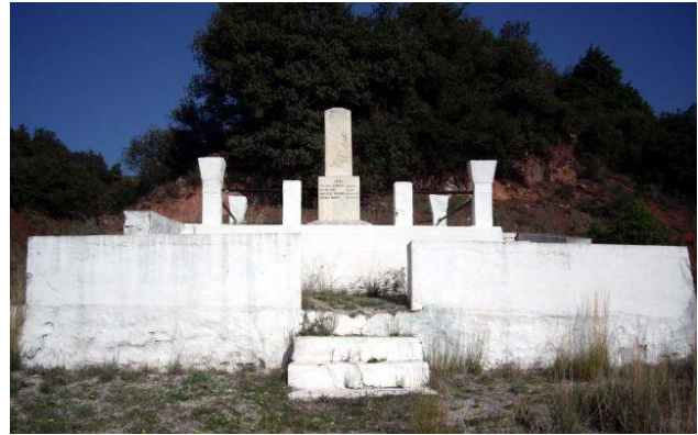
Εικόνα 8 Μνημείο Ταράτσα Λαμίας

Το σχετικό πρωτόκολλο υπογράφηκε στο χωριό Ταράτσα της Λαμίας στις 8 Μαΐου 1897 , με τους Οθωμανούς να έχουν ανακαταλάβει όλη τη Θεσσαλία.