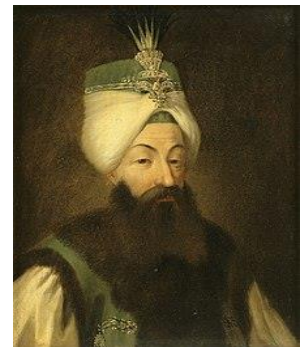
Εικόνα 5 Αμπτούλ Χαμίτ