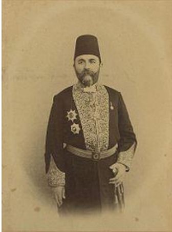
Εικόνα 4 Γεώργιος Βέροβιτς

Με προτροπή των μεγάλων δυνάμεων, τη διοίκηση της Κρήτης ανέλαβε ο χριστιανός Γεώργιος Βέροβιτς, πρώην διοικητής της Σάμου.