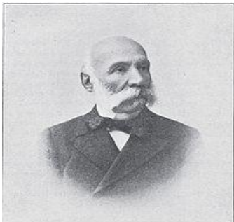
Εικόνα 1 Θεόδωρος Δηλιγιάννης

Στις αρχές του 1896 την Ελλάδα κυβερνούσε ο Θεόδωρος Δηλιγιάννης, ένας πολιτικός με δημογωγικές τάσεις.