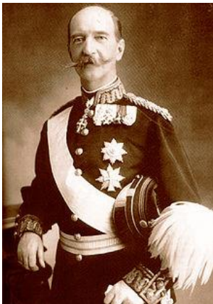
Εικόνα 6 Γεώργιος Α΄

Ο Δηληγιάννης, ευρισκόμενος σε δύσκολη θέση και υπό την πίεση των λαϊκών αντιδράσεων, αναγκάστηκε να στείλει στρατιωτικές δυνάμεις στην Κρήτη, γνωρίζοντας ότι αυτό θα αποτελούσε αιτία πολέμου για την Υψηλή Πύλη.