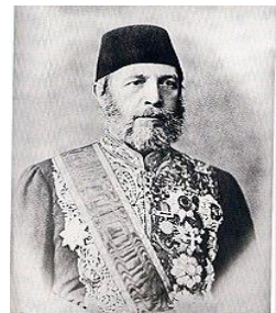
Εικόνα 2 Καραθεοδωρής

Η διακυβέρνηση της μεγαλονήσου από τον ελληνικής καταγωγής Καραθεοδωρή Πασά είχε στεφθεί από αποτυχία.