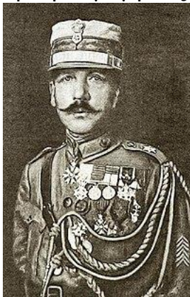
Εικόνα 9 Στρατηγός Θ. Πάγκαλος

Η κυβέρνηση Δηλιγιάννη, για να αντιμετωπίσει το οικονομικό πρόβλημα της χώρας, είχε περικόψει τις στρατιωτικές δαπάνες, ενώ ο κομματισμός βασιλεύει στο στρατό, με την προαγωγή στις ανώτερες θέσεις ανίκανων αξιωματικών.