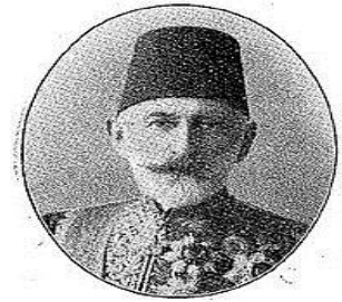
پترسبورغ سدیری طرخان پاشا